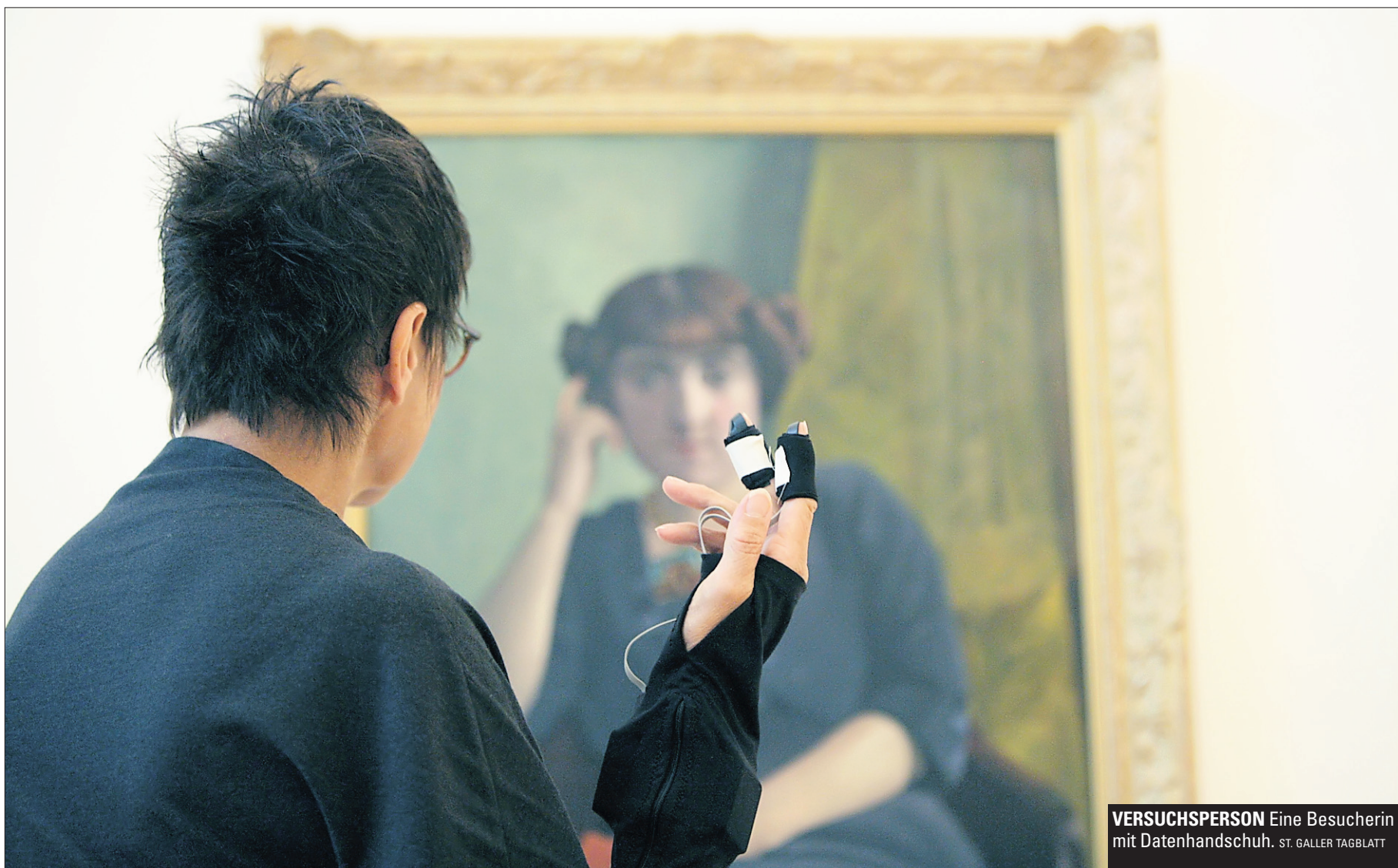
VERSUCHSPERSON Eine Besucherin mit Datenhandschuh.

Im Kunstmuseum St. Gallen werden Ausstellungsbesucher in ein wissenschaftliches Experiment über die Wirkung von Kunst einbezogen. Ein Selbstversuch