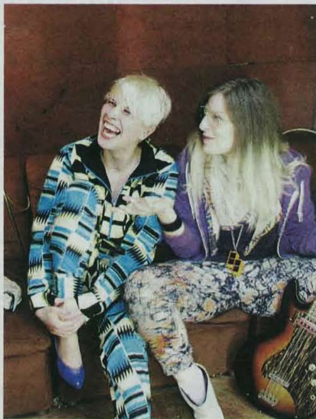
... dieses Mal aber auch durch die Berliner Sick Girls.

Headliner wurden die Sick Girls aus Berlin verpflichtet, dazu spielen lokale Plattendreher wie Charly Waste oder Larry King Sounds von Electro bis Mash-up. Alles ab 22 Uhr. tna