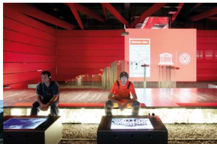
^... und andererseits eine Ausstellung in der Hauptwerkstätte Samedan.