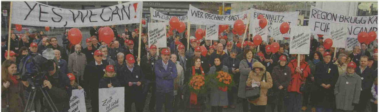
Grossaufmarsch von Aargauer Politikern und Stimmbürgern am Aktionstag der beiden Komitees «Ja zum Campuskauf» Anfang Januar in Brugg und Windisch.