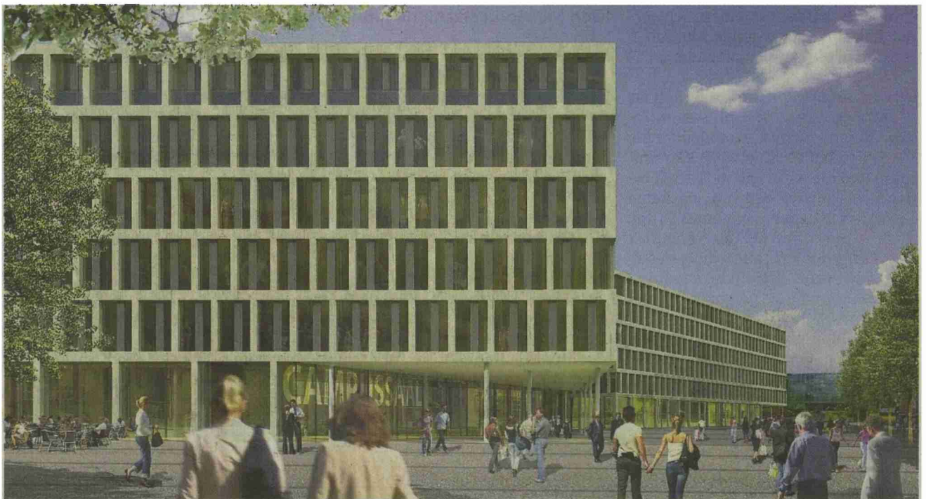
So soll der geplante Campus-Neubau auf dem Markthallenareal Windisch aussehen.

Brugg-Windisch Am 13. Februar entscheidet das Aargauer Stimmvolk, ob der Fachhochschul-Campus gekauft wird