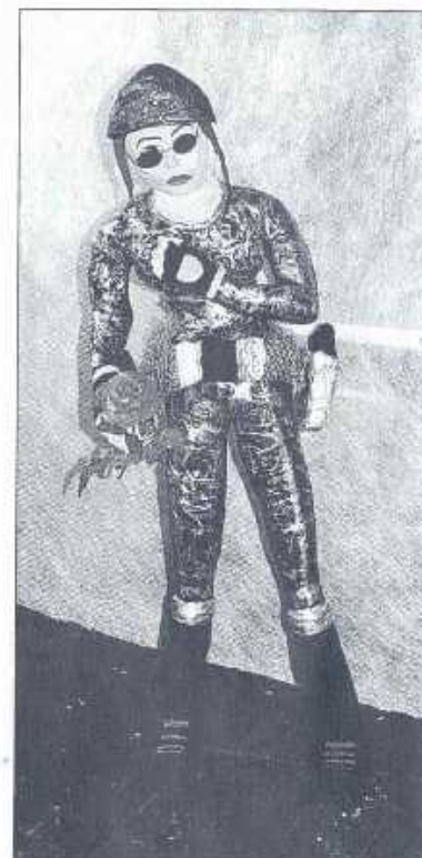
Schönheitsideal Dick und Dünn als lustvolles Experiment.

«Figur – Figuren»: Ausstellung im Jugendwerkhof Tommasini, Seonerstrasse 23, Lenzburg (Spazierzeit vom Bahnhof etwa 20 Minuten). Offen für die Öffentlichkeit am Sonntag, 6. Juni, von 11 bis 16 Uhr. Offen für Schulklassen bis 20. Juni jeweils 8 bis 11 und 14.15 bis 16.30 Uhr. Interessierte Lehrpersonen können den Schlüssel beim Sozialdienst der Stadt Lenzburg holen, Empfang im Parterre, Bahnhofstr. 1. Voran-