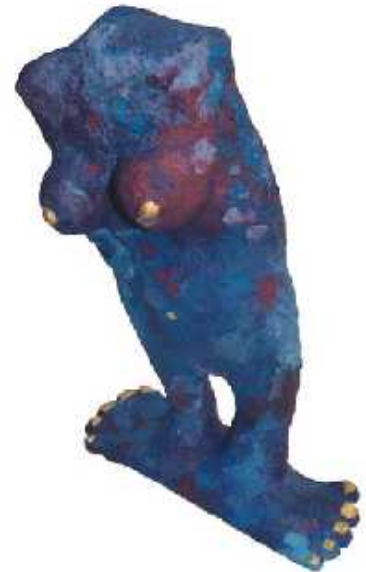
Little Blue, geschaffen von Jacqueline Rüegg, 3. Sek Untersiggenthal

Die Ausstellung «Von der Werkstatt auf den Laufsteg» war für weitere Schulklassen zugänglich. Sie vereinigt eine Auswahl der entstandenen Werke, würdigt die Arbeiten und konfrontiert die Besucherinnen und Besucher ihrerseits mit Formen, Rundungen und Proportionen. Didaktische Materialien geleiteten durch die Ausstellung und ermöglichen weiteren Klassen, sich mit Fragen rund um die ideale Schönheit auseinander zu setzen.