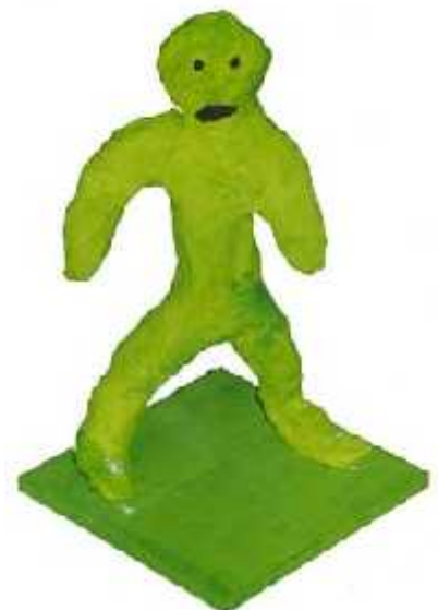
Das grüne Monster, geschaffen von Monika Cantieni, Werkjahr Dottikon