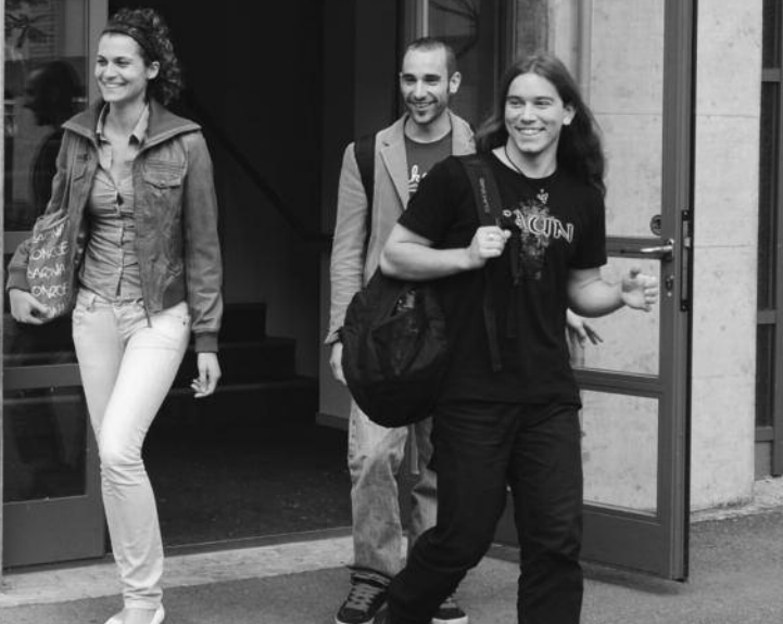
Studierende der Pädagogischen Hochschule FHNW

Notenschnitt eine gute Allgemeinbildung zu bescheinigen.