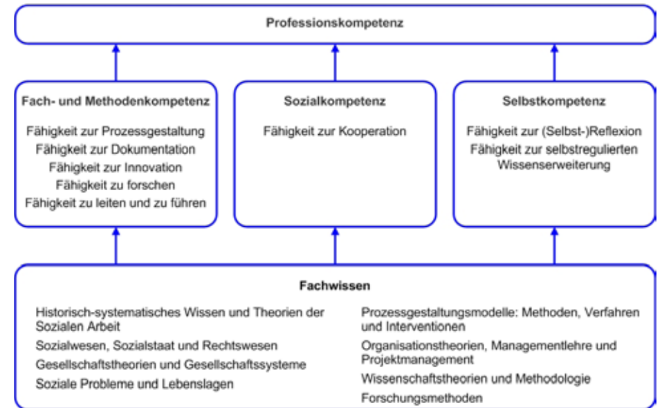
Abbildung: Schematische Übersicht über die zu erwerbenden Wissensinhalte und Kompetenzen im Master-Studium in Sozialer Arbeit an der Hochschule für Soziale Arbeit FHNW.

Diese Leistungen können nur vor dem Hintergrund einer im Studium erworbenen Kompetenz der Vermittlung von Theorie und Praxis erbracht werden, wofür eine mehrjährige Schulung im theoretischen bzw. wissenschaftlichen Denken und in der Handlungspraxis eine unabdingbare Voraussetzung ist. Die Studierenden erwerben im Master-Studium an der Hochschule für Soziale Arbeit FHNW acht Kompetenzen sowie spezifisches Wissen in acht Fachwissensgebieten (vgl. Abbildung S. 5). Das Kompetenzprofil der Hochschule für Soziale Arbeit FHNW wurde als Gesamtkonzept für das gestufte Studienmodell nach Bologna entwickelt. Es legt differenziert nach den Stufen «Bachelor», «Master» und «Ph.D.» das zu erwerbende Wissen und die zu entwickelnden Kompetenzen («learning out-come») dar und folgt der Grundidee, dass die drei Stufen nicht unabhängig voneinander gedacht und konzipiert werden können.