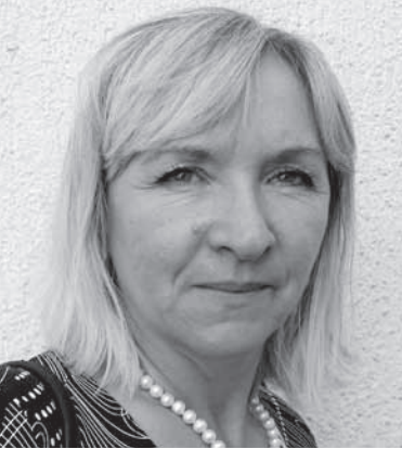
Suada Selimovic Ministerium für Arbeit und Sozialpolitik