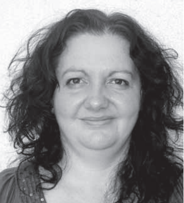
Mima Dahic Trauma-Therapiezentrum Vive Zene

«Diese Art der Kooperation stellt sicher, dass Praxis und Theorie zusammenkommen.»