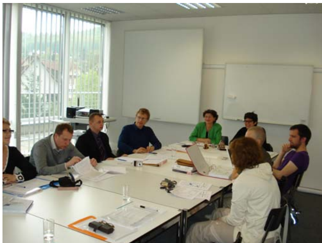
Erstmals nahm ein Vertreter aus der Praxis, der Erziehungskolonie für Minderjährige in Wologda, am Treffen teil.

Das Projekt wurde von der Hochschule für Soziale Arbeit FHNW und der Hochschule für Recht und Ökonomie in Wologda weiterentwickelt. Folgende Arbeitsziele wurden für die nächste Kooperationsphase definiert: Die Entwicklung eines prozessorientierten Methodenhandbuchs, das die Grundlage für die Ausbildung von Sozialarbeitenden im Strafvollzug in Wologda bilden soll und der gegenseitige Austausch von Lehr- und Lernmethoden.