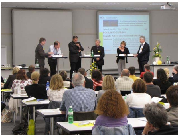
Angeregte Diskussion am Podiumsgespräch.

Pauls (2004) sieht Klinische Sozialarbeit im Kontext einer gesundheitspezifischen Fachsozialarbeit. Er greift damit den Zusammenhang von Sozialer Arbeit und Gesundheit auf. Dieser Zusammenhang ist nicht neu und wird aktuell in einer grossen Anzahl gleichnamiger Institute für Soziale Arbeit und Gesundheit im deutschsprachigen Raum repräsentiert, so beispielsweise an den Hochschulen Berlin, Heidelberg, Frankfurt, Wilhelmshaven, Coburg, Kiel, Wien, Nordwestschweiz, u.a.