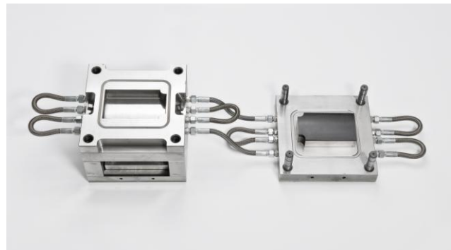
Abbildung 2 - Werkzeug für die Herstellung der Faserverbund Blättern