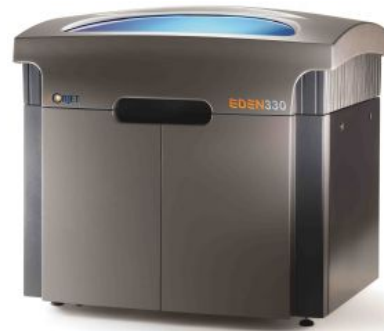
3D - Printer Objet EDEN 330

Für weitere Informationen betreffend einer Zusammenarbeit rufen Sie uns unverbindlich an oder kontaktieren Sie uns per E-Mail.