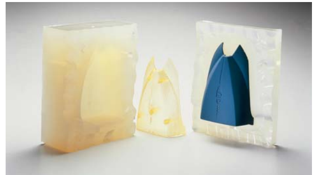
Vakuumgiesswerkzeug mit Formteil

Beim Vakuumgiessen wird in einem ersten Schritt von einem Master-Modell eine Silikonform erzeugt, welche in einem zweiten Schritt als Werkzeug für das Duplizieren der gewünschten Bauteile eingesetzt wird.