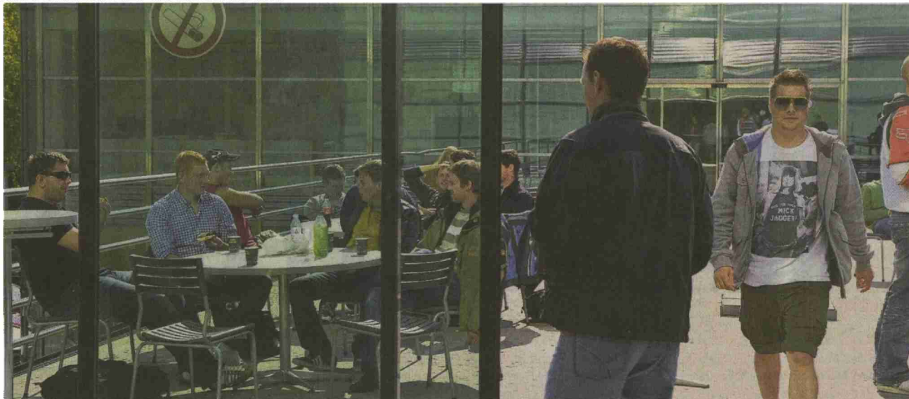
• Studienbeginn an der Fachhochschule: Seit Montag ist der Campus in Windisch wieder belebt.

Am Mittag ergiesst sich ein Strom von jungen Menschen aus den Zimmern nach draussen in die Herbstsonne, rein in die Mensa, zur Kaffeemaschine. Ähnlich wird es an den anderen Standorten der FHNW aussehen: Nach einer langen Sommerpause lebt man wieder auf dem Campus der Fachhochschule Nordwestschweiz.