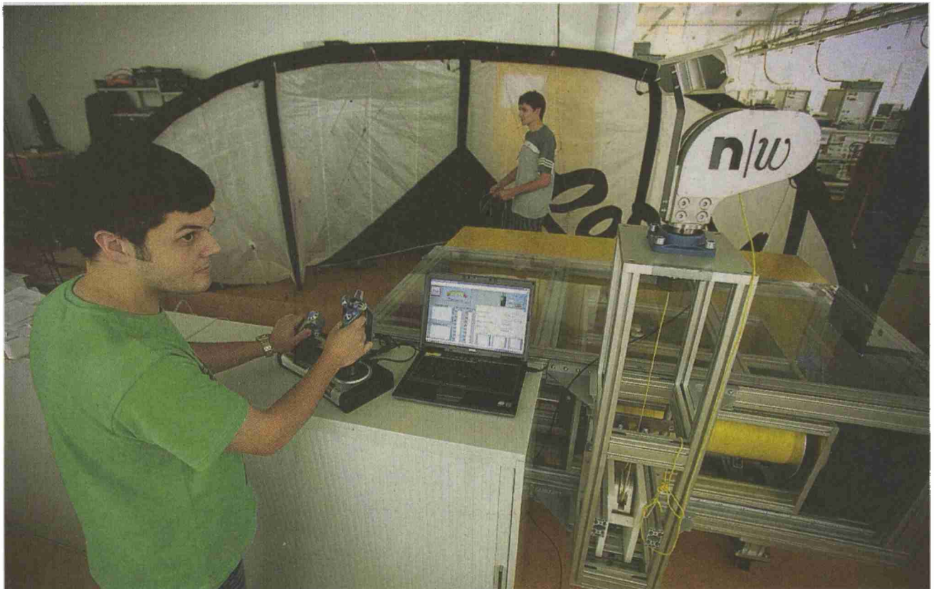
Arbeiten am «Swiss Kite Power Project»: In ihrer Bachelor-Thesis entwickeln die Studierenden eine Steuereinheit für den Drachen (hinten), der Strom erzeugen soll.

Ausbildung Die Hochschule für Technik Windisch startet im Herbst mit dem neuen Studiengang «Energie- und Umwelttechnik»