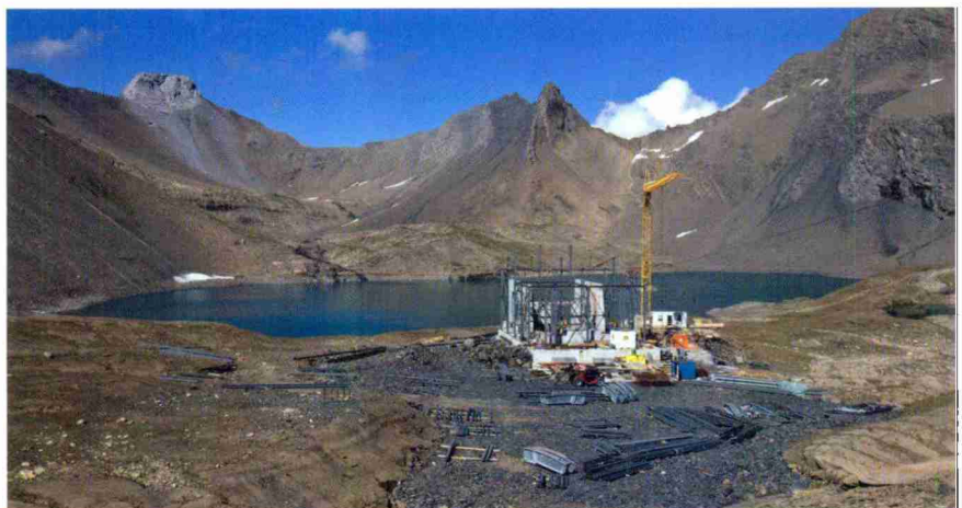
Wasserkraftwerk Linth-Limmern wird zum Pumpspeicherkraftwerk ausgebaut

Bei 5 bis 6% muss man alles umsetzen, was möglich ist: ein neuer Kühlschrank, ein neuer Fernseher usw. Realistisch ist wohl eher 1 bis 2% Einsparung. Für den Einzelnen scheint dies zwar nicht viel, schweizweit kommt so aber eine respektable Menge an Kilowattstunden zusammen. Wird die Anzeige in Zukunft mitteilen,