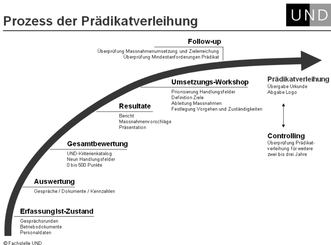
Abbildung 2: Prozess der Prädikatverleihung «Familie UND Beruf»

In einem Follow-up wird nach einem definierten Zeitraum die Zielerreichung der Massnahmen überprüft, der Prozess reflektiert und festgestellt, ob die Anforderungen für die Prädikatverleihung erreicht sind.