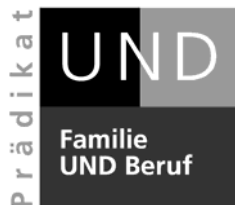
Abbildung 3: Logo Prädikat «Familie UND Beruf» der Fachstelle UND

Nach zwei bis drei Jahren erfolgt ein erstes Controlling. Wenn die Überprüfungsresultate positiv ausfallen, wird das Prädikat für weitere zwei bis drei Jahre verliehen.