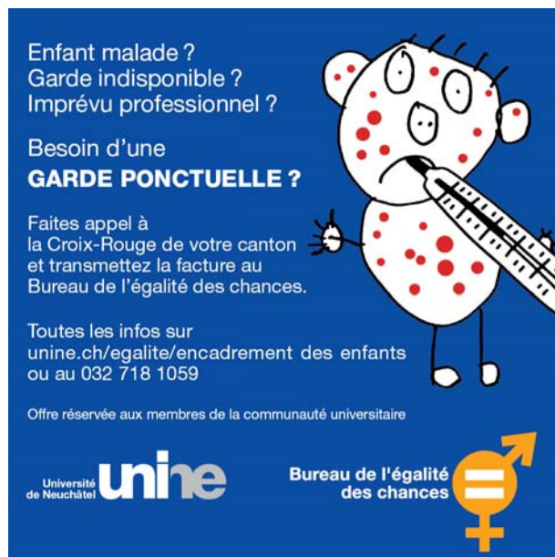
Abbildung 6: Flyer zur Kinderbetreuung bei unvorhergesehenen Ereignissen der Universität Neuenburg

Eltern können nicht immer freinehmen, wenn ihr Kind krank wird oder ihre Betreuungsorganisation einmal nicht zur Verfügung steht. Eltern müssen manchmal auch dringende und unvorhergesehene berufliche Verpflichtungen erfüllen. Alle Angehörigen (Mitarbeitende/Studierende) der Universität Neuenburg können sich in einem solchen «Notfall» an das Rote Kreuz wenden, um kurzfristig eine Betreuung für ihr Kind/ihre Kinder zu organisieren. Die Eltern nehmen selbstständig mit dem Roten Kreuz in ihrem Wohnkanton Kontakt auf; die Rechnung des Roten Kreuzes können sie dem Büro für Chancengleichheit der Universität Neuenburg zur Kostenübernahme übergeben. Das Büro für Chancengleichheit kann bei Inanspruchnahme dieser Dienstleistung seit dem 1. Januar 2008 den Hochschulangehörigen die Kosten für diese Kinderbetreuungsdienstleistung erstatten (Detaillierte Informationen unter: www2.unine.ch/egalite ).