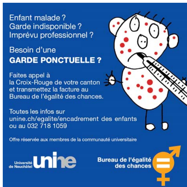
Abbildung 6: Flyer zur Kinderbetreuung bei unvorhergesehenen Ereignissen der Universität Neuenburg

Eltern können nicht immer freinehmen, wenn ihr Kind krank wird oder ihre Betreuungsorganisation einmal nicht zur Verfügung steht. Eltern müssen manchmal auch dringende und unvorhergesehene berufliche Verpflichtungen erfüllen. Alle Angehörigen (Mitarbeitende/Studierende) der Universität Neuenburg können sich in einem solchen «Notfall» an das Rote Kreuz wenden, um kurzfristig eine Betreuung für ihr Kind/ihre Kinder zu organisieren. Die Eltern nehmen selbstständig mit dem Roten Kreuz in ihrem Wohnkanton Kontakt auf; die Rechnung des Roten Kreuzes können sie dem Büro für Chancengleichheit der Universität Neuenburg zur Kostenübernahme übergeben. Das Büro für Chancengleichheit kann bei Inanspruchnahme dieser Dienstleistung seit dem 1. Januar 2008 den Hochschulangehörigen die Kosten für diese Kinderbetreuungsdienstleistung erstatten (Detaillierte Informationen unter: www2.unine.ch/egalite ).