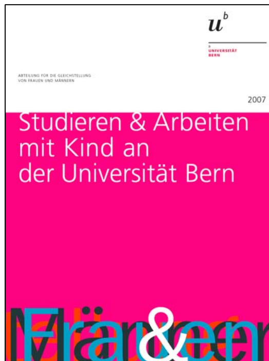
Abbildung 4: Broschüre «Studieren & Arbeiten mit Kind an der Universität Bern»

Praxisbeispiel: «Kinder und Universität – Informationen für (zukünftige) Mütter und Väter» der Universität St. Gallen