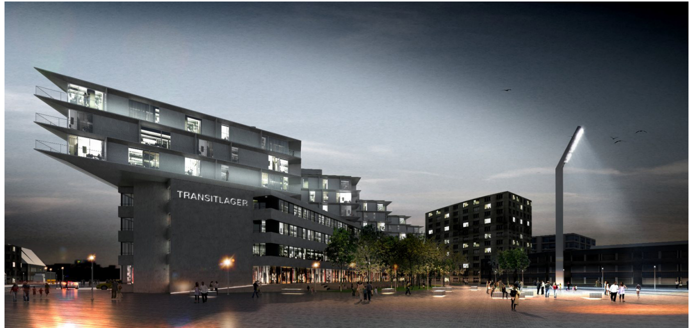
Visualisierung Transitlager , BIG Architekten

www.innenarchitektur-szenografie.ch www.masterstudiodesign.ch www.fhnw.ch/hgk/iis