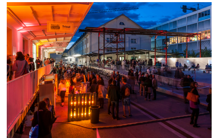
Oslo-Night auf dem Campus der Künste