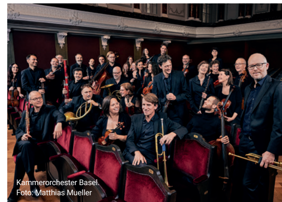
Kammerorchester Basel.