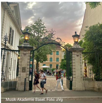
Musik-Akademie Basel.

30. Mai 2024 Stadtcasino Basel 5. Juni 2024 Stadtcasino Basel 19. Juni 2024 Musik-Akademie Basel Großer Saal