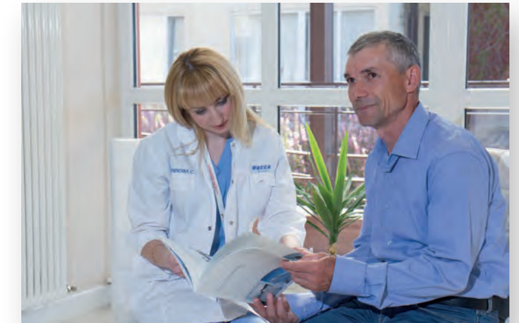
DIE PATIENTEN WERDEN IM HERZZENTRUM MIT IHREM PERSÖNLICHEN ACCOUNT UND DEM ONLINEFRAGEBOGEN VERTRAUT GEMACHT. DURCH REMOTE MONITORING KANN EINE PROAKTIVE UND INDIVIDUELLE BEHANDLUNG DURCH DEN SPEZIALISTEN ERFOLGEN.