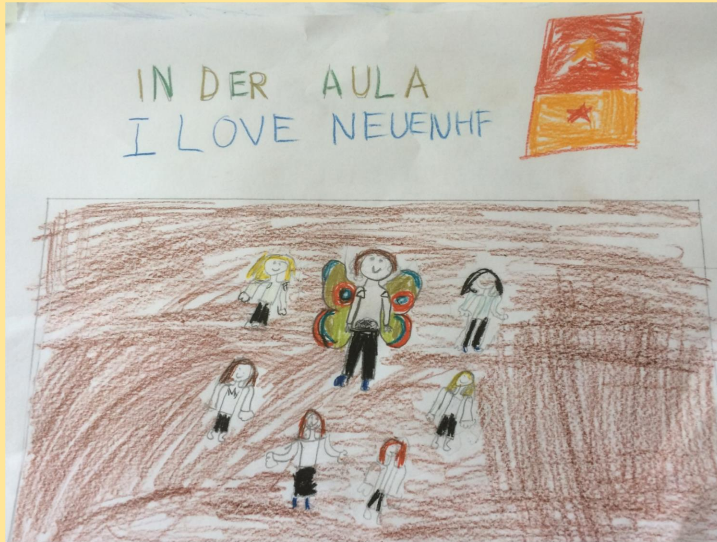
Interkulturelle Woche mit Musikgruppe SaSSa 2017