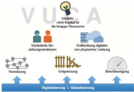
Abbildung 7: Trends, die die Unternehmensumwelt verändern (Weinreich, 2016 S.6)