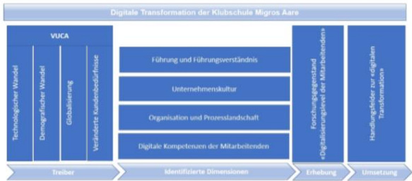
Abbildung 3: Digitale Transformation der Klubschule Migros Aare (eigene Darstellung, 2018)