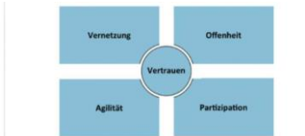
Abbildung 17: VOPA+ Modell basierend auf Buhse, 2014 (Petty 2016 S.44)

«Es scheint eine dringende Notwendigkeit, dem organisationalen Rahmen innerhalb der digitalen Transformation genügend Beachtung zu schenken und den Fokus nicht zu einseitig auf den Einsatz und Nutzung von digitalen technologischen Möglichkeiten zu beschränken»