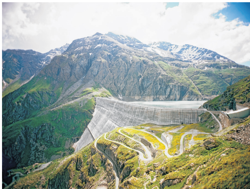
Die Staumauer der Wasserkraftwerksanlage Grande Dixence in den Walliser Alpen.