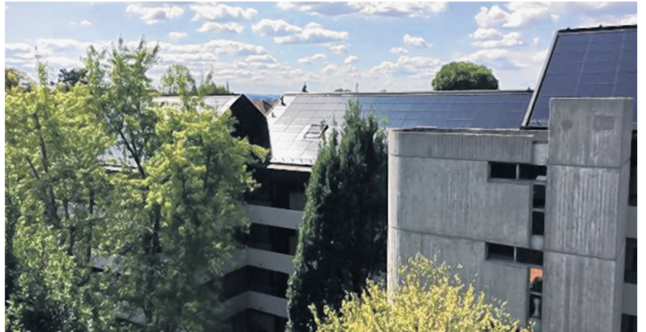
Oberdorfstrasse 3, das Gebäude der Alterssiedlung «Drei Brunnen».

Durch das stetige Anwachsen des Elektrofahrzeugbestands nimmt auch die Zahl der Gebrauchtbatterien zu. Zurzeit werden Batterien nach der Nutzung in Elektrofahrzeugen in der Regel einem energetischen Recycling zugeführt. Die Produktion sowie das Recycling von Lithium Batterien sind energie- und rohstoffintensiv. In der