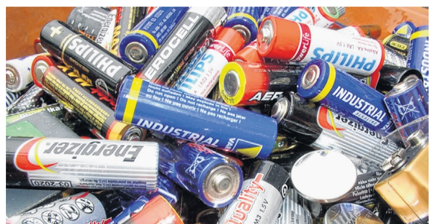
Batterien enthalten Wertstoffe, die durch die Industrie wiederverwendet werden können.

Werden die Batterien nicht richtig entsorgt, gelangen die enthaltenen Schadstoffe auf der Deponie über das Sickerwasser oder über Reststoffe der Kehrichtverbrennungsanlagen in die Umwelt und verursachen schwere Schäden. Der einzig richtige Entsorgungsweg für Batterien ist die fachgerechte Wiederverwertung.