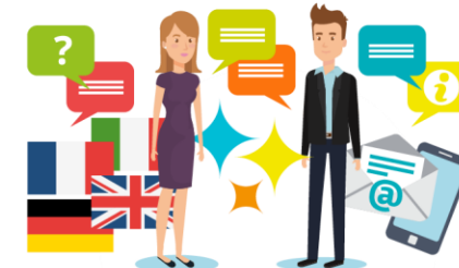
Gestalten von Kunden- oder Lieferantenbeziehungen