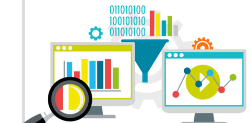
Einsetzen von Technologien der digitalen Arbeitswelt