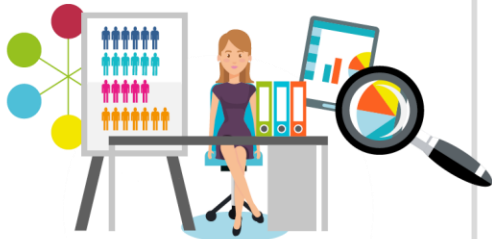
Handeln in agilen Arbeits- und Organisationsformen