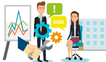
Interagieren in einem vernetzten Arbeitsumfeld