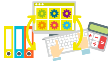
Koordinieren von unternehmerischen Arbeitsprozessen