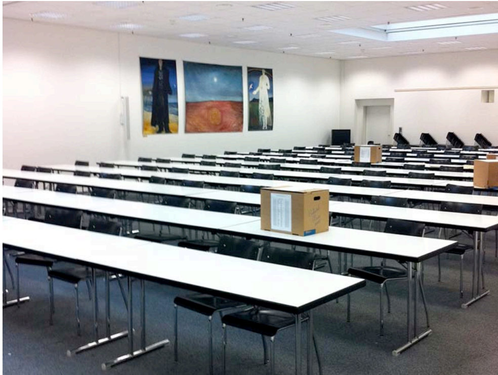
Abb. 4.1: Präsenzunterricht als bevorzugte Unterrichtsform des Lernen 1.0

Dafür wird nicht zuletzt der hohe Zeitdruck im Bologna-Prozess verantwortlich gemacht, der dem selbstorganisierten Lernen unter Web 2.0 entgegen wirkt (Rheinmann et al. 2006, S. 255): „Die inhaltliche Fülle und damit verbundene Zeitknappheit führen fast unweigerlich zu einem individualökonomischen Kalkül, nach dem vor allem solche Leistungen erbracht werden, die im Credit-Point-Konto des Fachstudiums verlangt sind. Individuelles und soziales Engagement in studentischen Projekten oder kollaborative Initiativen, wie sie im Zuge von Weg 2.0 favorisiert und nahe gelegt werden, fallen der persönlichen Ökonomisierung vielerorts zum Opfer.“