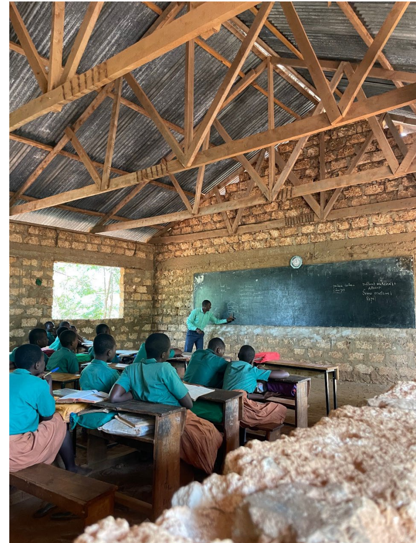
Jaribuni Primary School Kenia, Januar 2022

Intermobil ermöglicht 25 Studierenden den Erwerb von interkultureller Kompetenz während eines Fokuspraktikums im Ausland.