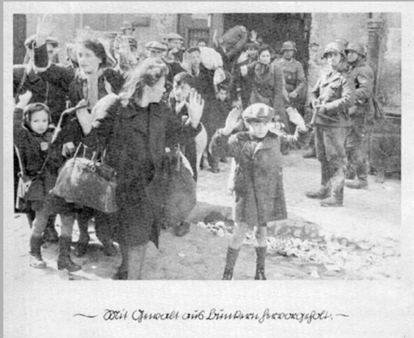
Stroop- Bericht, Bild 14