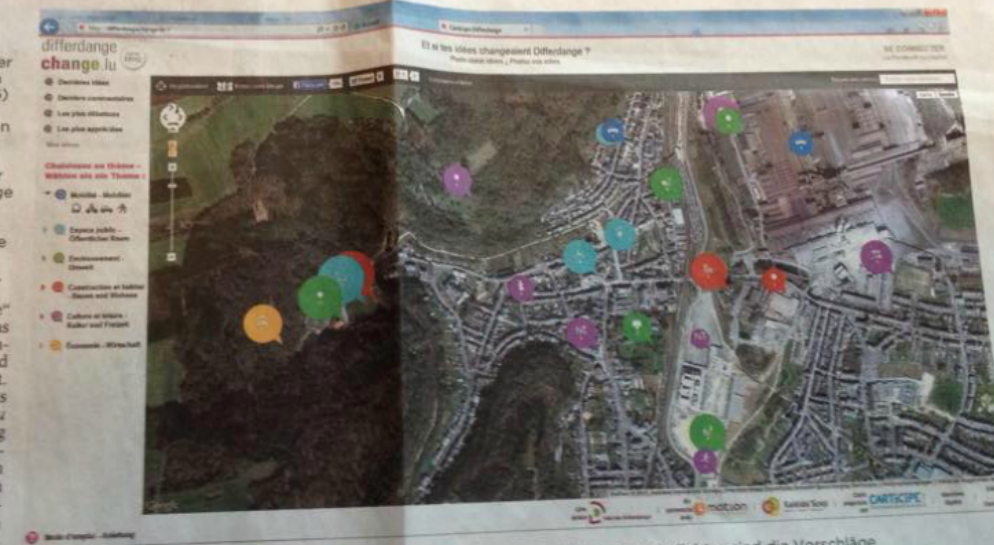
Screenshot der Homepage differdangechange.lu . Je größer der Punkt ist, desto beliebter sind die Vorschläge.

Eine andere Nutzerin möchte dem Hadir-Tower mit Studentenwohnungen neues Leben einhauchen. Weitere beliebte Empfehlungen sind etwa die Schaffung