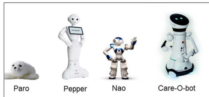
Abbildung 1: Die meistverkauften und meist eingesetzten sozialen Roboter

Die EU-Robotikstrategie 2020 geht davon aus, dass die Robotertechnologie in den kommenden zehn Jahren zur vorherrschenden Technologie und «jeden Aspekt des Berufs- und Privatlebens beeinflussen wird» (EU-OSHA, 2016). Nachweislich sind bspw. die Verkaufszahlen für Serviceroboter allein zwischen 2016 und 2017 um 85% (109'543 Einheiten) angestiegen (IFR, 2018). Als stark wachsender Sektor werden „public relation Roboter“ von der Internationalen Roboter Föderation (IFR) ausgewiesen. Hier wurde ein Zuwachs von 2016 auf 2017 von 56% (10'400 Einheiten) dokumentiert (IFR, 2018). Mit sozialen Robotern wird angestrebt, einen Mangel an Fachkräften (z.B. im Pflege- und Betreuungsbereich) oder die alternde Bevölkerung kompensieren zu können. Gleichzeitig ging im Oktober 2018 die Meldung durch die sozialen Medien, dass in einem Nikkei Tech Survey 23 von 27 befragten Firmen ihre Pepper-Lizenzen infolge fehlender klarer Use Cases nicht verlängern wollten ( https://www.therobotreport.com/renewals-softbank-pepper-robot-lag/ ).