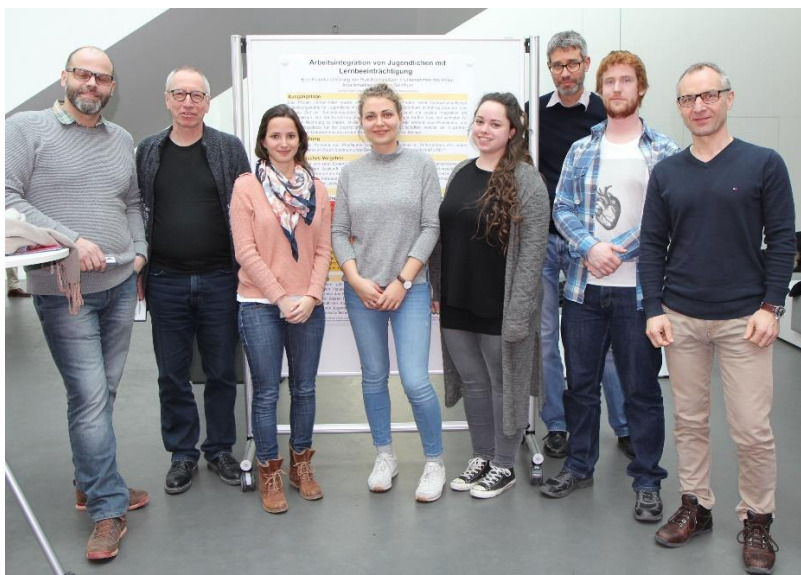
Abschluss öffentliche Präsentation Projektteam, PWB und AG HS17/18

https://www.fhnw.ch/de/studium/soziale-arbeit/bachelor/projektwerkstatt-und-studierendenprojekte