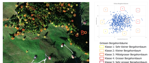
Abb. 3: Abschätzung Biodiversitätsbeitrag auf Grundlage der Grössen der Bergahornbäume im Gebiet Jenaz Ost (rot)

Der Kronendurchmesser und die Baumhöhen werden hergeleitet und durch das Kombinieren dieser beiden Faktoren wird die Grösse der Bäume nach Kategorien eingeteilt. Mit dieser Annäherung kann das Alter und somit der Biodiversitätsbeitrag der einzelnen Bäume abgeschätzt werden. Anhand einer Nachbarschaftsanalyse wird der Abstand der Bäume zueinander beurteilt (Abb. 3). Damit können Gebiete mit überalterten Bergahornen ermittelt werden, die von fehlender Verjüngung betroffen sein könnten. Der Abstand der Bäume ist auch ein Indiz für die Vernetzungsfunktion der einzelnen Tiere. Durch Einbezug von weiteren öfftl. Geodaten wird der Standort untersucht und eruiert wie viele Bergahornbäume sich in welchen Gebieten befinden.