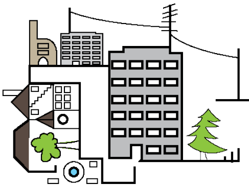
Siedlung und Wohnen