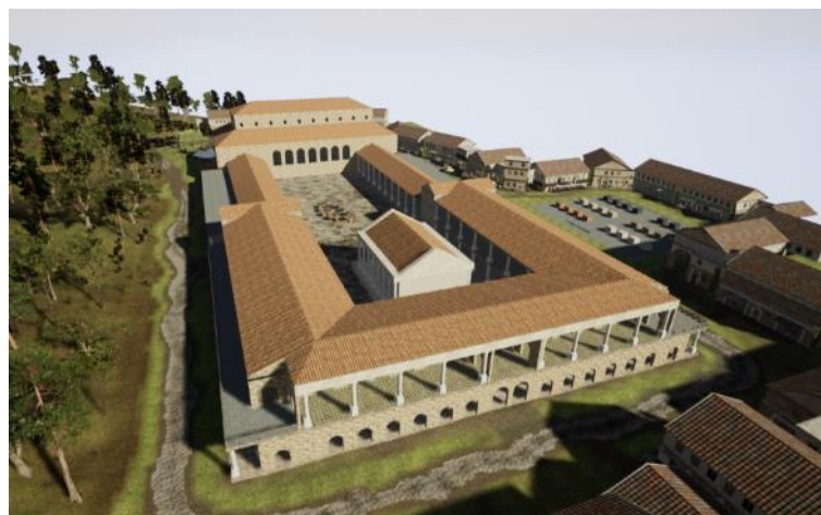
Abb. 1 Übersicht der VR-Szene mit nachmodelliertem Gebäude in der Mitte.

Für diese Arbeit stand die Virtual Reality Brille HTC Vive Pro zu Verfügung. In der Entwicklungsumgebung Unreal Engine 4 von Epic Games wurde die Virtual Reality Applikation erstellt. Um einen realistischeren Eindruck zu erzeugen, wurde die Szene ausgeschmückt. Nebst dem nachmodellierten Gebäudemodell wurde die Szene mit Häusern, Vegetation und Gegenstände ausgestattet. Der Fokus dieser Arbeit lag dabei klar auf den verschiedenen Texturierungsarten und nicht auf der archäologischen Korrektheit in der Darstellung des Gebäudes aus Augusta Raurica. Die zusätzlichen Gegenstände und Häuser sind aus dem Unreal Engine Marketplace. Auf dem Textur Testfeld können die verschiedenen Texturierungstechniken betrachtet und deren Vor- und Nachteile direkt beurteilt werden. Die gesamte Szene hat eine Ausdehnung von rund 75'000 m 2 , wovon rund die Hälfte frei begehbar ist.